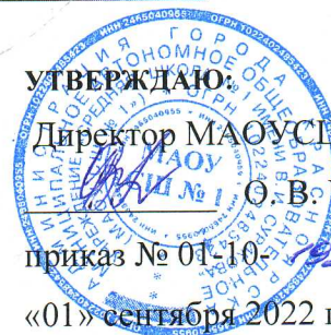
График приема пищи обучающихся МАОУ СШ №1.

Время приема пищи обучающихся по классам с учетом расписания перемен в МАОУ СШ № 1